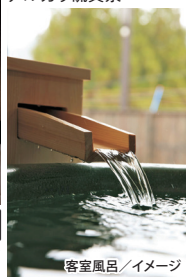
客室風呂/イメージ