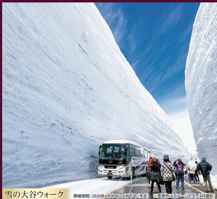
雪の大谷ウォーク

開催期間:2026年4月中旬～6月下旬(予定) ※雪景色はイメージです。(4月撮影)