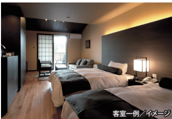
客室一例/イメージ

洋室または和洋室(露天風呂付き) 約41㎡ 日常から解放された離れの客室で大切な時間 をお過ごしください。