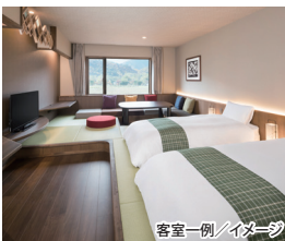
客室一例/イメージ

信州おもてなしの間・和室 約42㎡ 北アルプスの麓に門を構える宿は、ど こか懐かしい田舎の暮らしを体感する 時間が流れます。