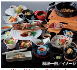
料理一例/イメージ