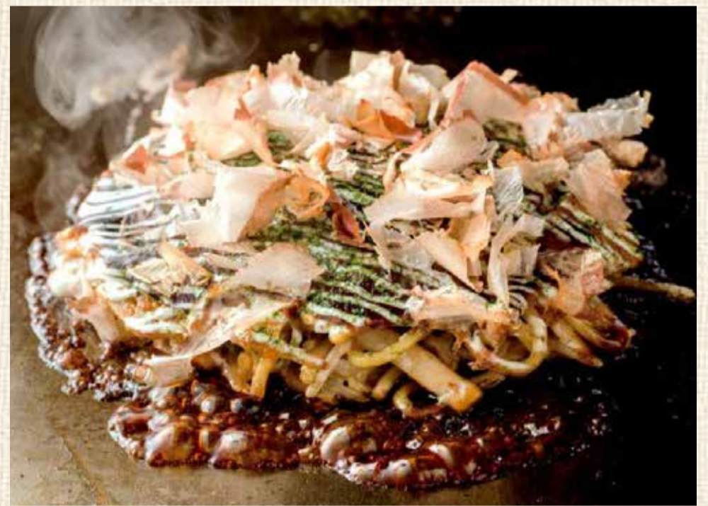
ミックスもだん焼