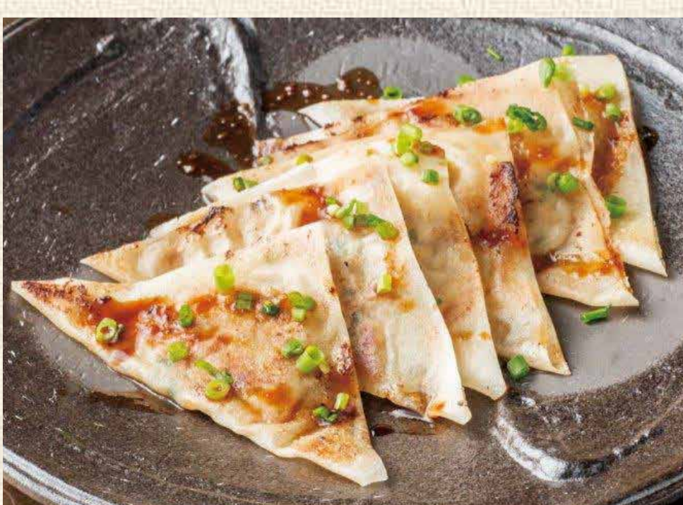
パリパリ鉄板餃子