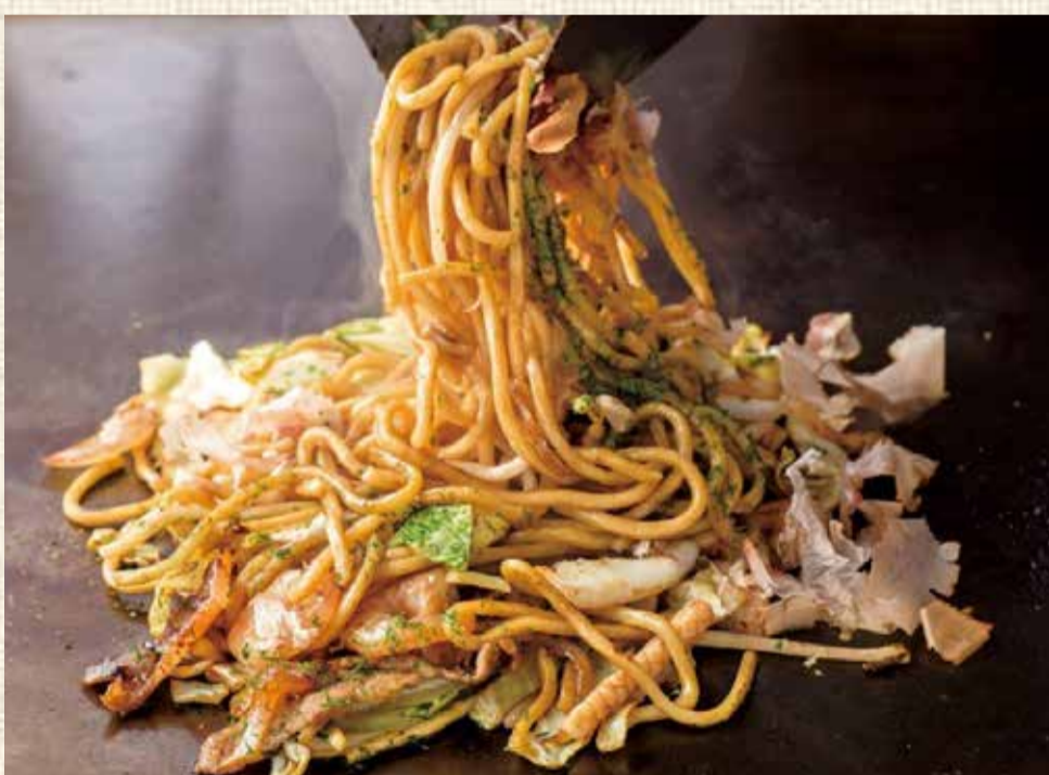
ミックス焼きそば